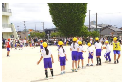
【確実に運べる手渡し作戦】

今年度、新たに取り組んだ競技が、「祝150周年 未来ヘトライ！」です。縦割り班を活かした競技ができないかと考え、子供たちに提案しました。班で1列になって、スタートからゴールまでラグビーボールを運ぶというシンプルな競技ですが、作戦の自由度が高く、走ってボールをつなぐ班や投げて一気にボールを運ぶ班等、様々な工夫が見られました。さらに、縦割り班で自由に使える練習時間を設け、新たな競技の練習だけではなく、50m走や玉入れ、綱引き等、団を優勝に導くための強化練習を行えるようにしました。自分たちの班に必要な練習を選び、時間いっぱい取り組む姿が見られました。