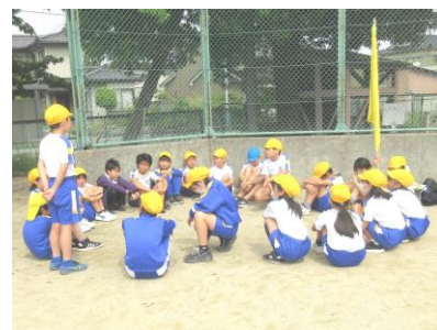
【応援練習後に話し合う子供たち】

運動会の花形の 하나가、応援合戦です。6年生は、団のスローガンを決め、エール、3・3・7拍子、応援歌の文言と振り付けを考え、下級生に伝えます。さらには、演出を考え、小道具を作って、楽しく盛り上がるような応援を創り上げていきます。最初は、動きもバラバラで声も小さかったのですが、練習を重ねるたびに、勢いが増していきます。応援内容だけではなく、下級生にどう伝えたらよいかなど、たくさんのことを考え、工夫し、運動会本番に向けて団を盛り上げていく子供たちは本当に頼もしく見えました。