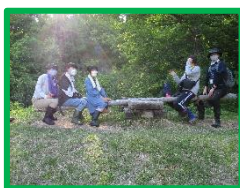
自然体験（春） （立山青少年自然の家）