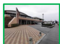
自然体験（冬） （立山青少年自然の家）