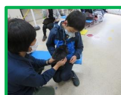
動物ふれあい体験 （ファミリーパーク）