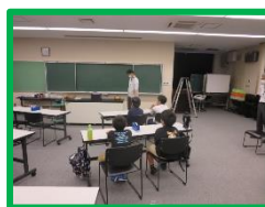
社会体験 （科学博物館）