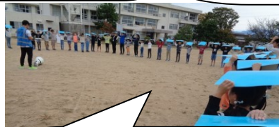
【航空写真撮影】 ドローン撮影をした写真を記念ファイルにして配付します。