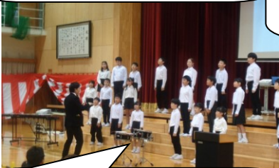
【3・4年 合唱・合奏】 区域連合音楽会の合唱に、合奏も加え、素敵な音楽を発表しました。