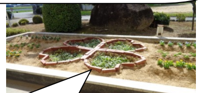
【正面玄関前の花壇造営】 子供たちのアイデアで、きれいな花壇が出来上がりました。

来賓や保護者の皆様からたくさん温かいメッセージもいただき、本当にありがとうございました。