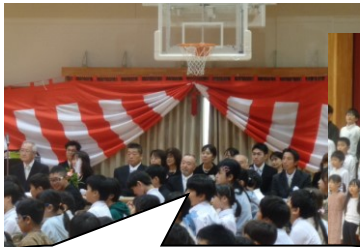
【創校80周年記念式典】 たくさんの来賓や地域の方々にもお祝いしていただきました。

また、今年度の学習発表会のスローガンは、「未来に届け、八幡の星～協力し、笑顔が輝く学習発表会」であり、一人一人が輝く素晴らしい発表となりました。80周年という節目に八幡小学校で学んだことに誇りをもち、校歌にある『はるか希望』である未来に向かって、これからも『力強く』『たゆまぬ努力』を重ねる子供たちを温かく応援し、見守っていただきたいと思います。