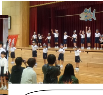
【5・6年 劇】 各教科や総合的な学習の時間に学んだことを生かし、八幡の未来への思いを込めて演じました。