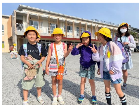
【ボランティアで参加した子供たち】