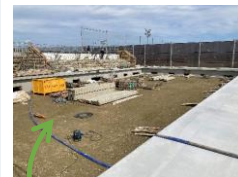
ここがプールになるよ！

水橋学園には、広いグラウンドや人工芝のテニスコート、100m走用のゴムチッププレーン、25mプールなどがあり、1年生から9年生まで、みんなが思いっきりからだを動かすことができます。校舎南側には低学年用の天然芝のしばふ広場もあるよ！