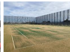
テニスコートのしばふ