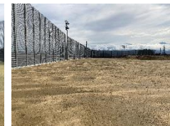
ひろいグラウンドが できてきたよ！