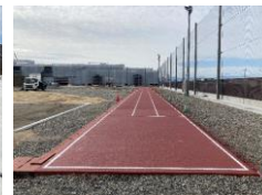
陸上用の ゴムチッププレーン