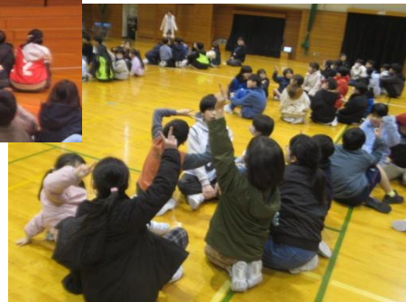
〔感謝の集会より 劇や給食クイズを楽しむ子供たち〕