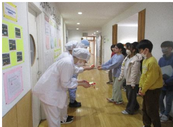
〔調理員さんへ感謝の手紙を渡す給食委員の子供たち〕