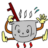
富山市子どもの村 イメージキャラクター ごえもんちゃん