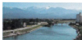
大海原へと流れる川をイメージ