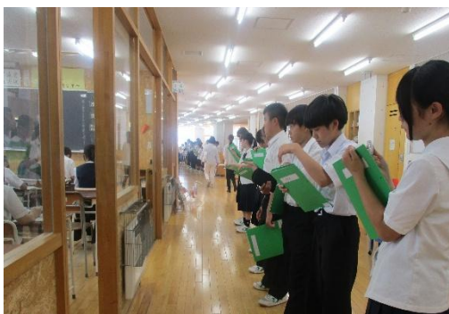
＜3年生の授業の様子を観察する1年生＞

こうした「素敵な当たり前」を積み重ねていくことが、自分も周りの人も幸せにし、脈々と「芝園プライド」を受け継いでいくことなのだと感じます。これからも生徒たちの素敵な姿をたくさん見つけ、応援していきたいと思います。