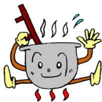
富山市子どもの村 イメージキャラクター ごえもんちゃん