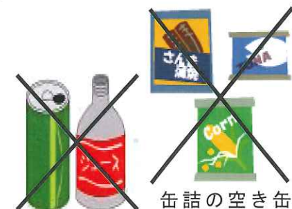
ジュースの空き缶