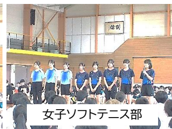
女子ソフトテニス部