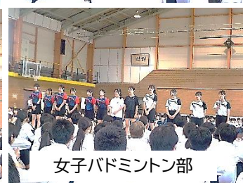
女子バドミントン部