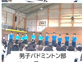
男子バドミントン部