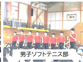
男子ソフトテニス部