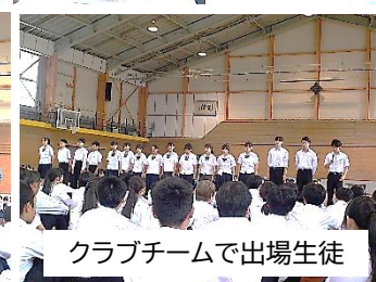
クラブチームで出場生徒