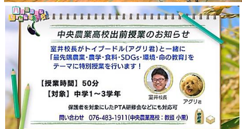
富山県立中央農業高校 室井校長先生「ハイスクールチャンネル Hyper(CATV 富山)」出演の様子