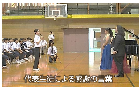
代表生徒による感謝の言葉