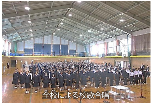
全校による校歌合唱