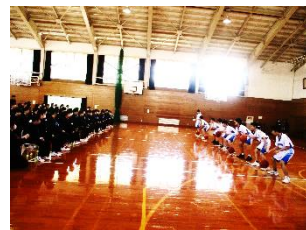
「部活動紹介」(左:美術部、右:バスケットボール部)