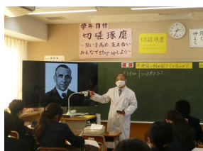
校長先生出前講座