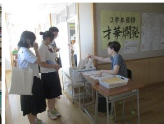
事前訪問前の最終確認