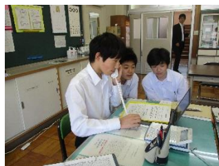
事前訪問前に時間等を打ち合わせ

いよいよ7/1から「社会に学ぶ『14歳の挑戦』」です。4月から多くの時間をかけて事前学習を重ねてきました。6月28日の結団式では、校長先生より励ましのお言葉をいただき、全員で気合いを入れました。学校の授業では学べない多くの体を通して、一回り大きく成長してくれることを楽しみにしています。