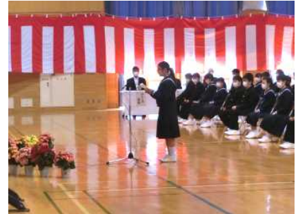
新入生「誓いの言葉」

4月8日（水）9：30から第74回入学式が行われました。今回、新型コロナウイルスの感染拡大を防止のため、2、3年生が不在の中での式となりましたが、多くの保護者や教職員からの拍手の中、182名の新入生は、真新しい学生服を身につけ、しっかりとした足取りで入場しました。