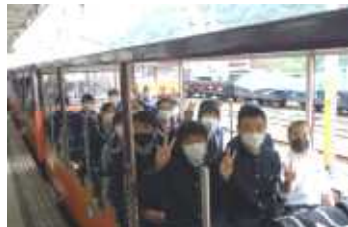
トロッコ電車乗車