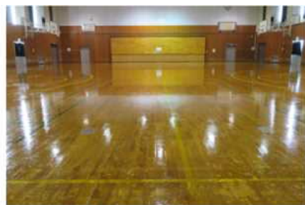
▲体育館の床はピッカピカ!