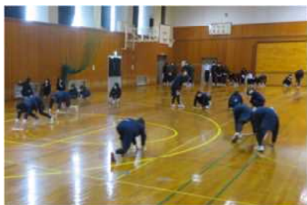
▲生徒による雑巾がけ

2月18日(金)終学活後、体育館のワックスがけを行いました。まず、体育館での運動部と美化実践部で、体育館の雑巾がけを行いました。(写真：左) そのあと、教職員でワックスをかけました。(写真：中) 体育館の床はピッカピカです。