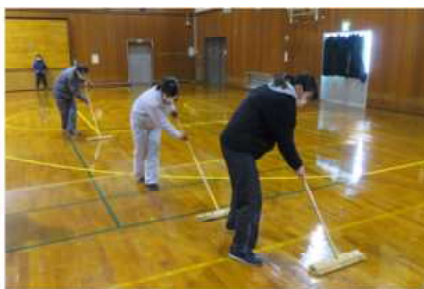
▲教職員によるワックスがけ