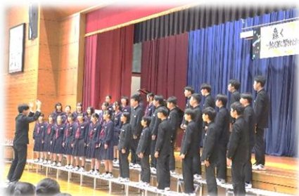
【3年1年 二十億光年の孤独】