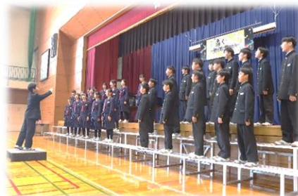
【1年2組 変わらないもの】