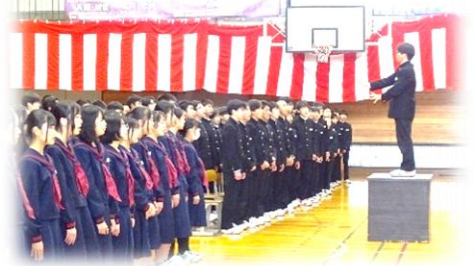
【在校生による歓迎の歌】