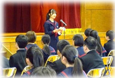
【在校生代表 歓迎の言葉】

満開の桜の花が新生を歓迎するように咲き誇るよき日に、第44回入学式を行いました。全校生徒423名がそろいました。