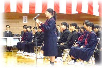
【新入生代表 誓いの言葉】