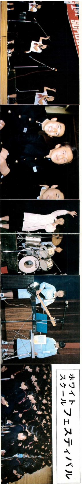
ホワイトフェスティバル