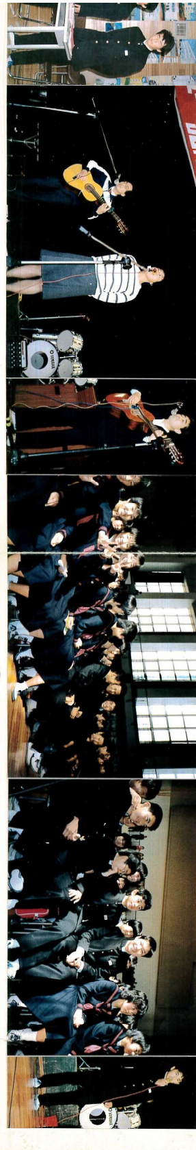
昭和58年度卒業アルバムから（第1回卒業生）