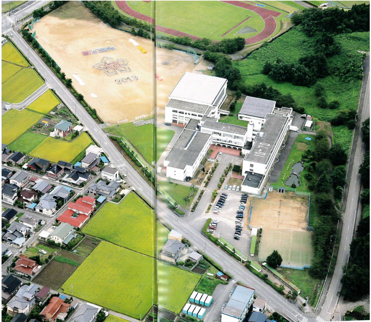
創校30周年記念誌から