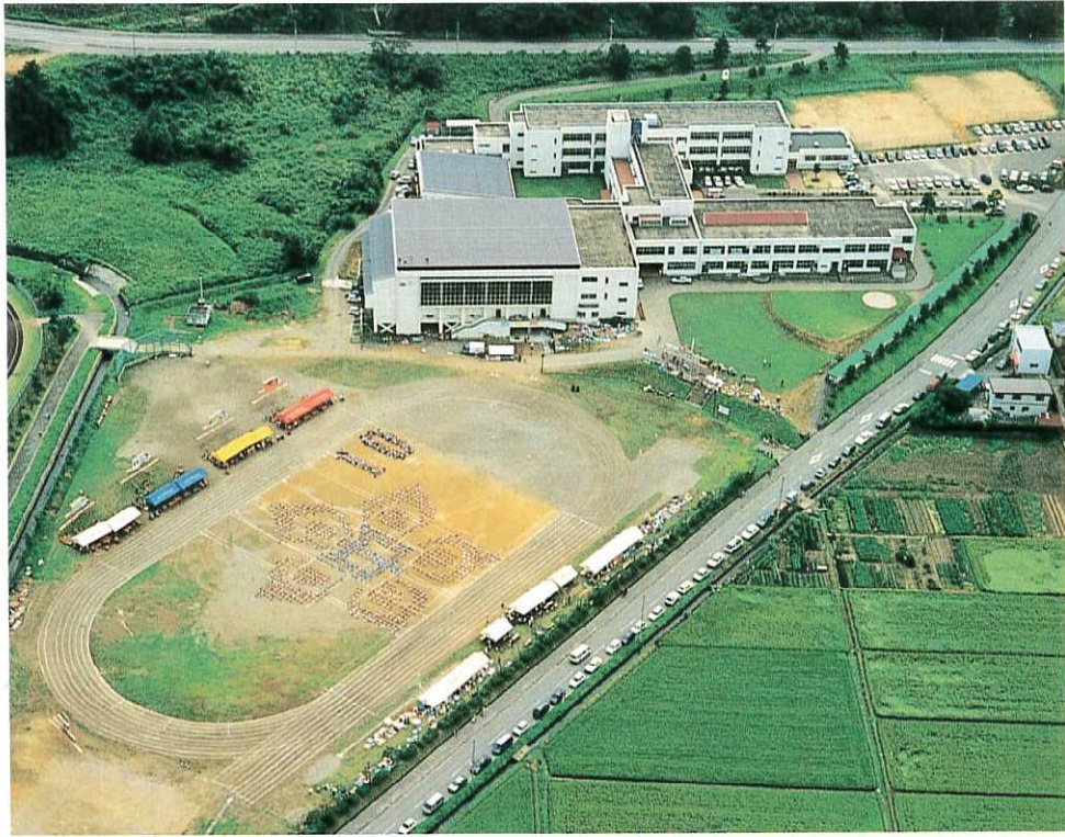
創校十周年記念体育大会