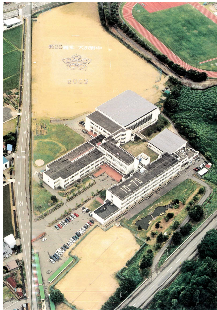
創校20周年記念誌から