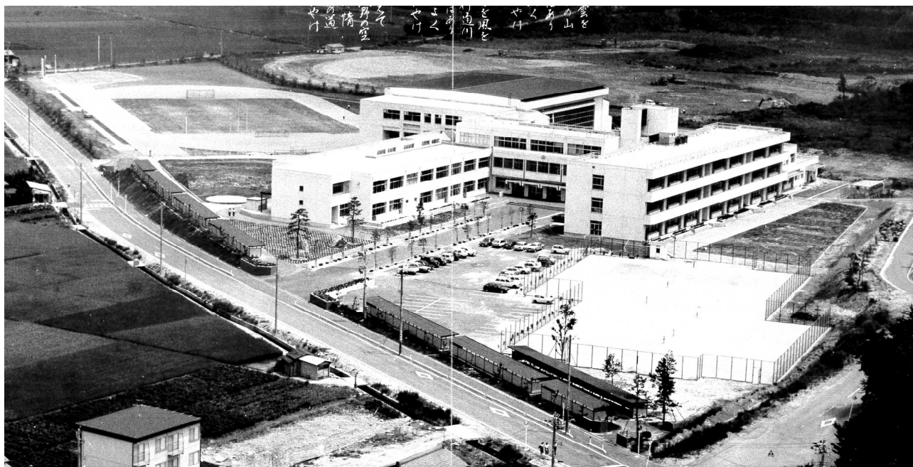
昭和58年度卒業アルバムから（第1回卒業生）

外には、野外ステージ（美術室の北側にある丸いところと芝生）や、すもう広場（友情の池と畑があるところに土俵が5つあった）があった。ちなみに、「友情の池」は昭和63年度に完成している。グラウンドには300mトラックがあり、トラックの中は芝生だった。