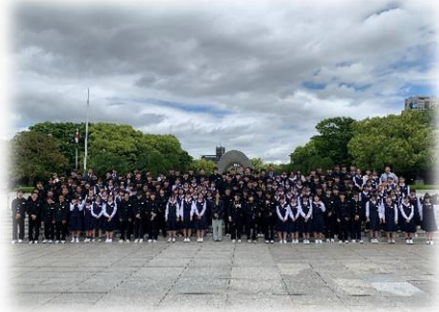
【2日目 広島平和記念公園】