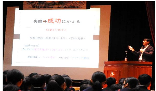
【先輩に学ぶ講演会】