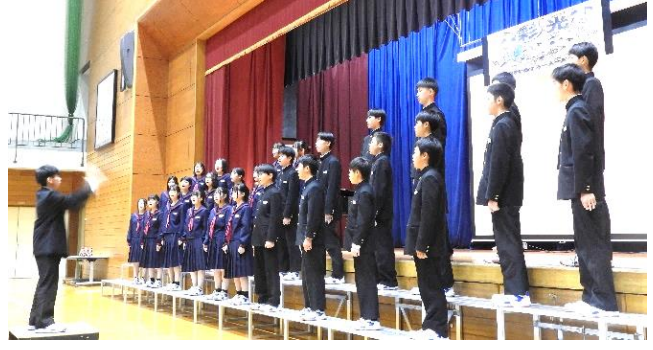
【第2学年 最優秀賞 1組 HEIWAの鐘】