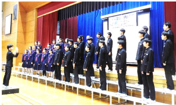
【第3学年 最優秀賞 2組 信じる】