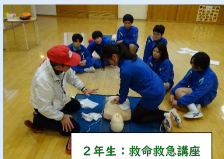
2年生：救命救急講座