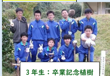
3年生：卒業記念植樹