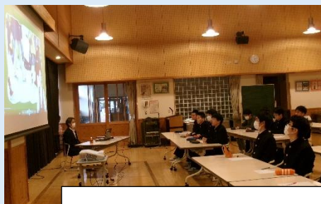
2、3年生：薬物乱用防止教室