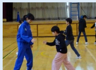
じゃんけんダッシュ