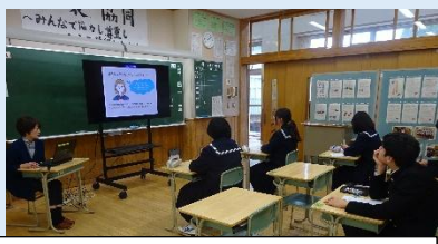
2年生：産婦人科医による講演会