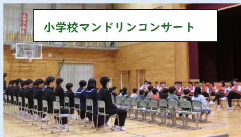
小学校マンドリンコンサート