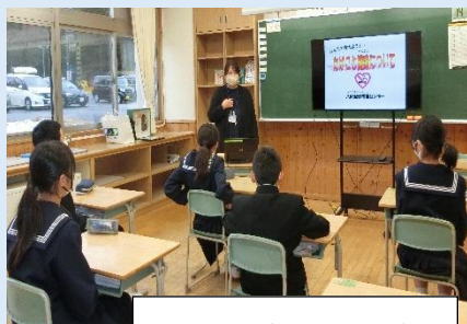
1年生：喫煙防止教室