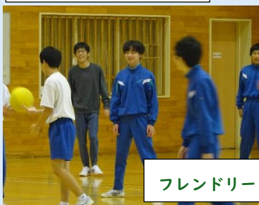
フレンドリーフェスティバル