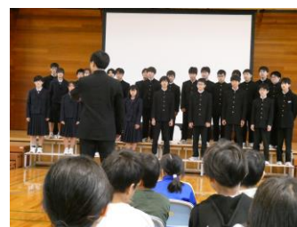
中学生の合唱の発表