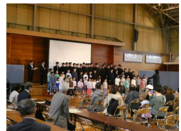
小中合同の合唱の発表