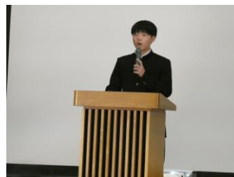
ユネスコ弁論大会スピーチ