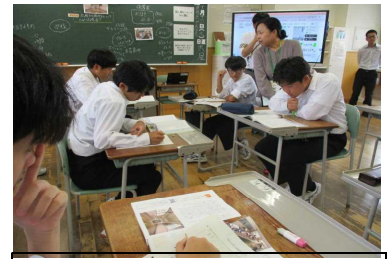
2年「四十七年に感謝を込めて」

「考え議論する道徳」に向けて、多くの先生方が研究授業実践を見に来られました。1年生は『郷土を彫る』、2年生は『四十七年に感謝を込めて』を教材に、郷土の発展や愛校心について、深く考えました。